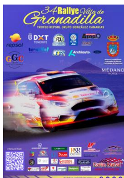
2 RALLYE VILLA DE GRANADILLA 13/06/2026