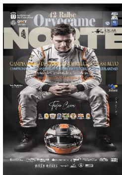
1 RALLYE ORVECAME NORTE 11/04/2026